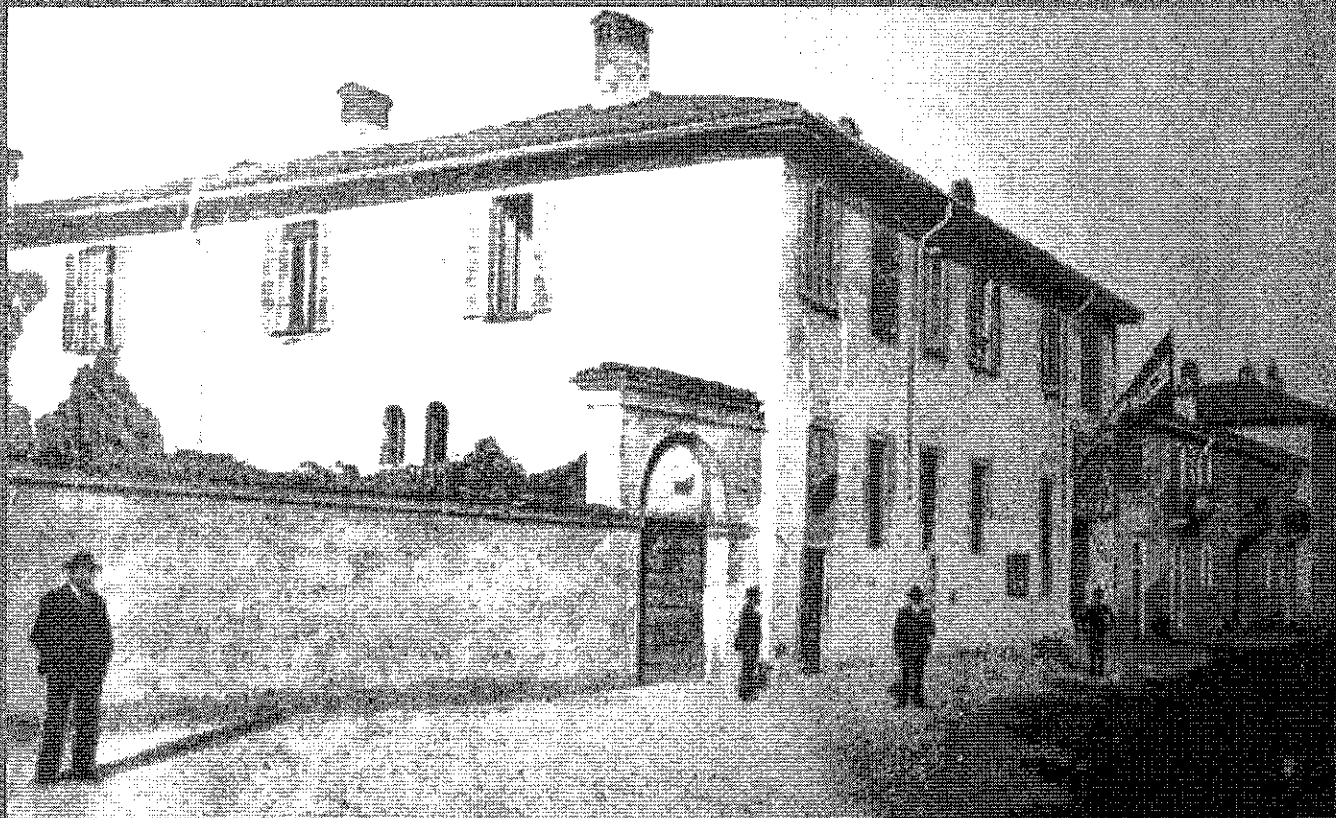
Immagine del 1905