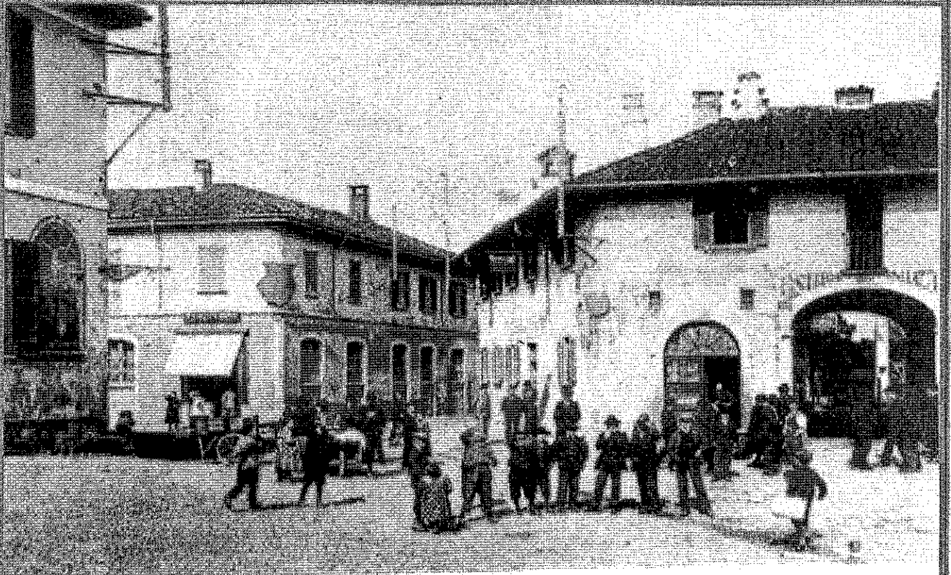
Immagine del 1918 Piazza Vittorio Emanuele III ora Piazza Matteotti