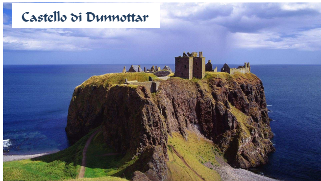
Castello di Dunnottar

Lungo il tragitto sosta a Stonehaven, piccolo porto peschereccio al sud di Aberdeen, dove sarà possibile ammirare le rovine del Castello di Dunnottar (sosta fotografica) che fu lo scenario del film Macbeth di Zeffirelli, e che domina il Mar del Nord dalla cima di un impressionante picco roccioso. Arrivo ad Aberdeen e sistemazione in hotel. Cena e pernottamento.