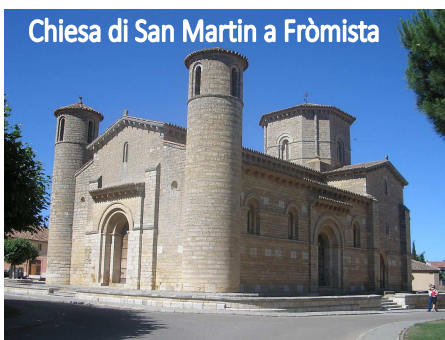
Chiesa di San Martin a Frómista

Prima colazione in hotel. Incontro con la guida, e partenza per Fromista, importante nodo di comunicazioni e luogo di passaggio del cammino di Santiago. Il più grande gioiello di Frómista è la chiesa di San Martín, un'opera d'arte concepita come immagine. Questa chiesa, eretta nel 1035, spicca per la purezza delle linee e il perfetto equilibrio tra l'elemento architettonico e la ricchissima decorazione. A due chilometri dal centro urbano si trova la fontana di Pozomingo, nella quale sono state scoperte vestigia di quella che forse era Frómista in epoca romana, prima dell'occupazione araba. Proseguimento per Leon città sul fiume Bernesga, capoluogo della provincia omonima.