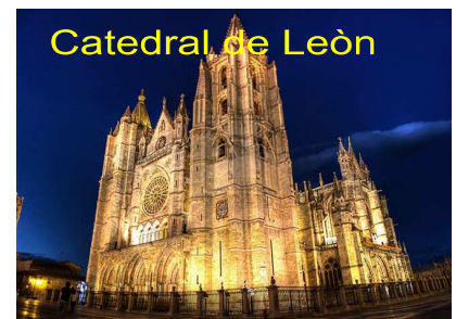
Catedral de León

Possiede numerose chiese e cattedrali rinomate per l'architettura e il patrimonio artistico. Tra queste spicca la Catedral de León , chiesa gotica del XIII secolo, ricca di torri e di archi rampanti. La Basilica de San Isidoro in stile romanico risale invece al X secolo ed è celebre per gli affreschi e le tombe reali. Sistemazione in hotel 4* a Leon. Cena e pernottamento