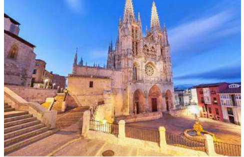
Catedral de Burgos

Prima colazione in hotel. Incontro con la guida e partenza per Santander , capitale della Cantabria , con imperdibili spiagge e il Palazzo della Magdalena, una delle attrazioni principali della città. Proseguimento per Burgos, bella città della Castiglia e León, lungo il Cammino di Santiago, che custodisce importanti testimonianze della sua ricca storia medievale. Burgos, per ben cinque lunghi secoli capitale del regno unificato della Castiglia e León, vanta uno dei capolavori del gotico spagnolo, la magnifica Cattedrale, dichiarata Patrimonio dell'Umanità. Costruita su una vecchia chiesa romanica, l'edificio attuale è stato realizzato secondo un modello gotico franco-normanno. Le decorazioni delle guglie delle torri e della parte esterna della cappella del Condestable sono solo due dei tanti capolavori che caratterizzano questa struttura. Tanta bellezza e genio costruttivo hanno dato vita, all'interno, a un lungo elenco di capolavori: la cupola stellata che sovrasta le tombe del Cid e di Doña Jimena, il coro, il sepolcro e la scala dorata dell'architetto e scultore locale Diego de Siloé, una delle figure più rappresentative del Rinascimento spagnolo. Oltre a visitare il centro storico di Burgos, si devono percorrere i suggestivi itinerari che costeggiano i fiumi Duero e Arlanza. Al termine sistemazione in hotel. Cena e pernottamento