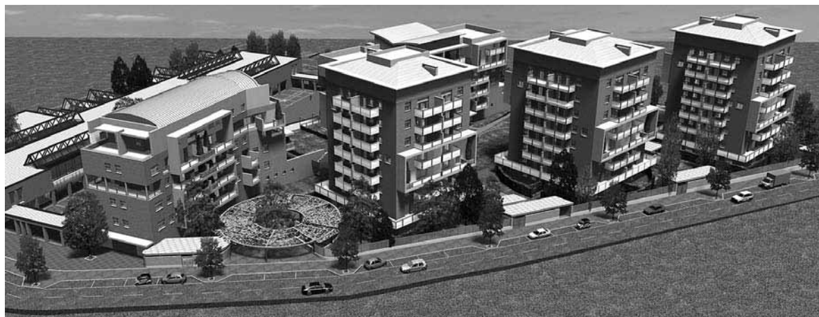
Nelle aree ex Tilane e Lares una quota degli appartamenti saranno in edilizia convenzionata, in base agli accordi assunti dal Comune di Paderno Dugnano rispettivamente con Cad Immobiliare srl e Filca Cooperative