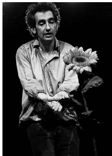
figure della letteratura la sua personalità è una somma di tanti individui. A volte sembra che sia Cristo stesso a parlare, con la sua parola infinitamente bella e chiara, altre volte invece sembra il Cavaliere dalla Triste Figura, comico e amaro, tragico e sublime insieme.

Ad ogni rilettura L'idiota regala suggestioni e riflessioni nuove. Il Principe Myskin non è mai uguale a se stesso, e come tutte le grandi