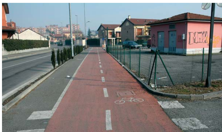
Ciclabile Via Magenta