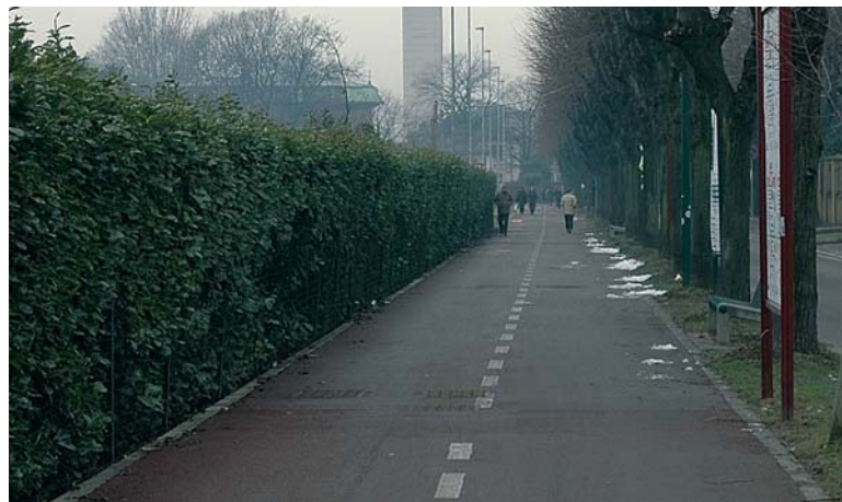
Ciclabile Via Grandi