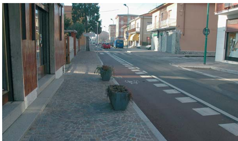
Ciclabile Via Riboldi