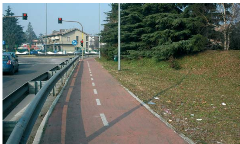
Ciclabile Via Reali