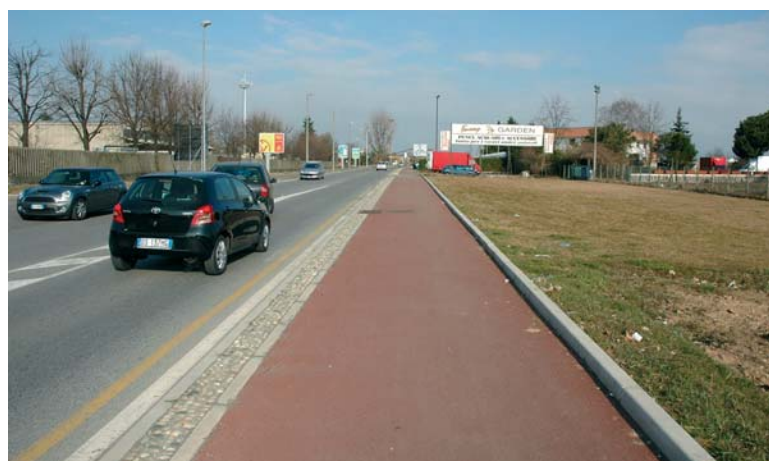
Ciclabile Via Toscanini