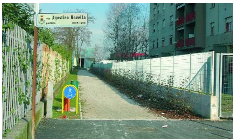
Ciclabile Via Santi