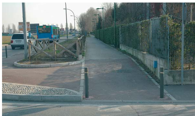
Ciclabile Via Santi - Novella