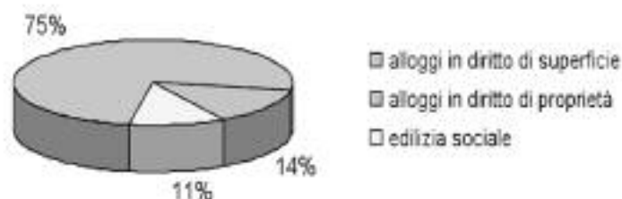
SUDDIVISIONE DEGLI ALLOGGI REALIZZATI NEL PIANO CONSORTILE DI PADERNO DUGNANO

I Piani sopra indicati, suddivisi in 83 interventi, comprendono circa 3.280 alloggi per i quali sono state stipulate convenzioni che hanno riguardato 2.445 assegnazioni di alloggi su aree in diritto di superficie (corrispondenti al 75%), 463 cessioni di alloggi su aree in proprietà (14%) e la restante parte è stata destinata all'edilizia sociale (11%).