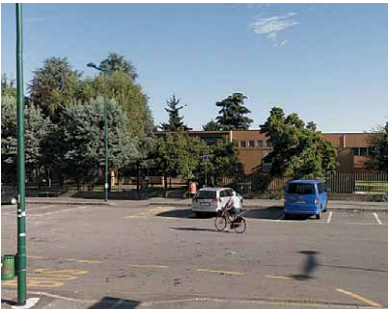
Scuola media di Piazza Hiroshima, a Palazzolo

Nel dettaglio si darà corso alla riqualificazione e messa a norma della scuola media di Piazza Hiroshima, a Palazzolo, assistita da un finanziamento ministeriale di € 650.000,00: l'inizio lavori è previsto nel periodo estivo.