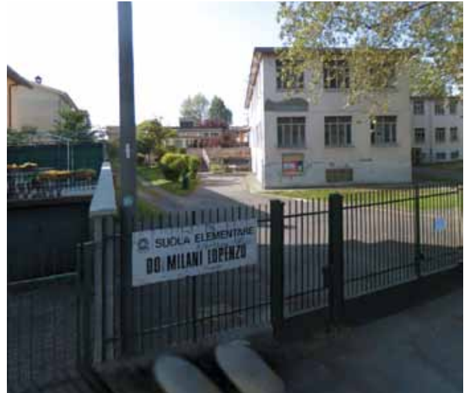
Scuola elementare don Milani di via Mascagni

Le opere fondamentali di quest'anno vedono l'edilizia scolastica come priorità. Ci sono ben 8 scuole che quest'estate vedranno l'allestimento di cantieri diffusi e funzionali per risolvere problematiche che si trascinano da anni.