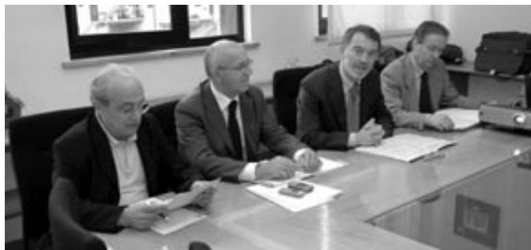
La conferenza stampa con Energie Locali

"Energie Locali - ha detto il presidente - è nata a fine maggio dello scorso anno e ai primi di ottobre abbiamo iniziato a lavorare sui due Comuni soci. L'obiettivo dei sindaci era consentire un risparmio significativo e dare alla società una struttura molto snella, quindi non costosa. Noi - ha proseguito - abbiamo inserito solo tecnici qualificati in grado di intervenire immediata-