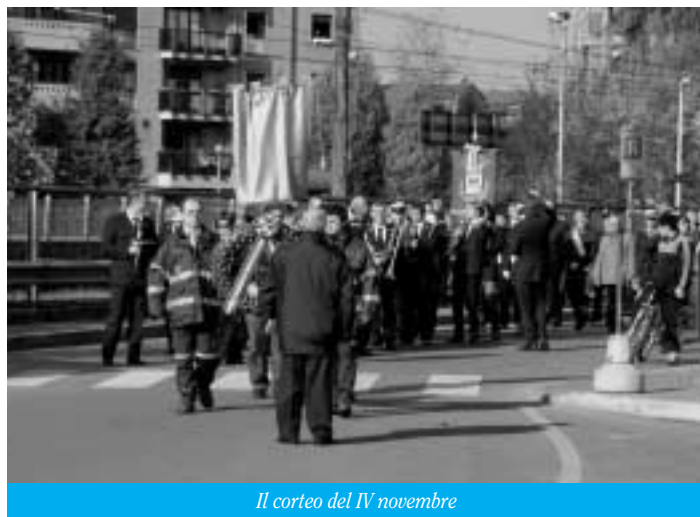
Il corteo del IV novembre

Una tragedia che, al suo termine, fece partire il dibattito sulla necessità di prevenire i conflitti su tavoli di accordo internazionale. Masetti ha ricordato la nascita e la vita, breve, della Società delle Nazioni e, dopo essere passati attraverso un'altra guerra mondiale, il ruolo dell'Onu. Un ruolo discusso dalle cro-