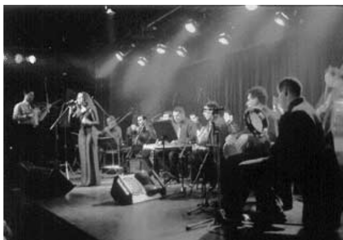
L'orchestra di Nazareth