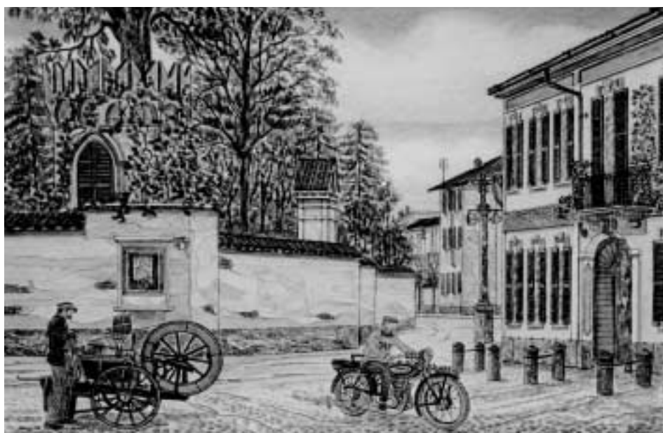
Vista dalla Piazza dell'Addolorata con la torretta Fisogni e la colonna Compitale

Nuove visioni di Palazzolo con un disegno sempre più ricco di dettagli, nuove atmosfere compositive e di periodo, ampi scorci di Brianza dove compaiono ricercate arie estive colte all'attimo, poi elaborate ninfee con particolari luminiscenze rilassanti e meditative, per rivedere infine Montmartre e percepirne la luce crepuscolare e i dettagli. Dal 4 al 19 dicembre Villa Fisogni ospiterà la personale di pittura di Giovanni Moretti, patrocinata dall'assessorato alla Cultura, che esporrà le ultime opere realizzate nel corso del 2004. Orari della mostra: inaugurazione sabato 4 dicembre ore 11 - sabato e festivi: ore 10-12,30 e 15-20 - feriali ore 17,30-19,30.