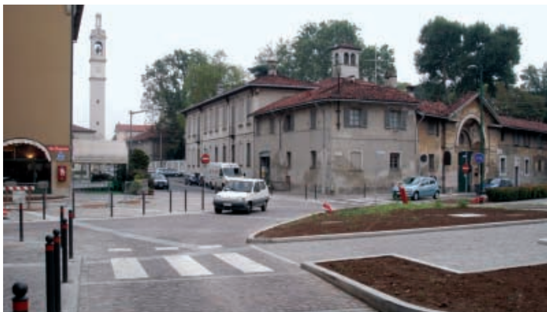
La rinnovata Piazza Matteotti