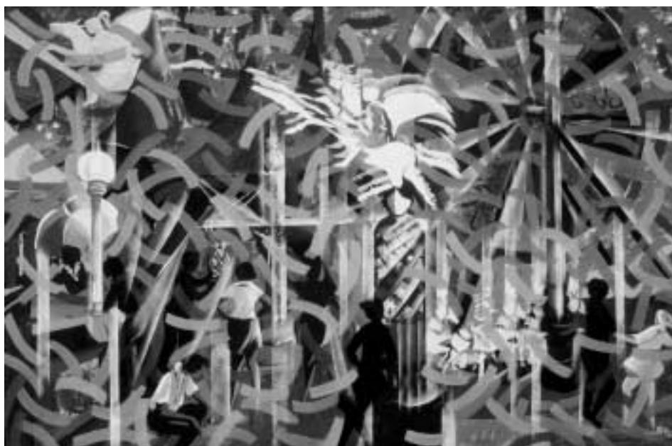
"Luna Park". Misura: 60x90; tecnica: acrilico; anno: 2001/74

Via Reali, 82 S.s. Comasina di Paderno Dugnano (Milano)