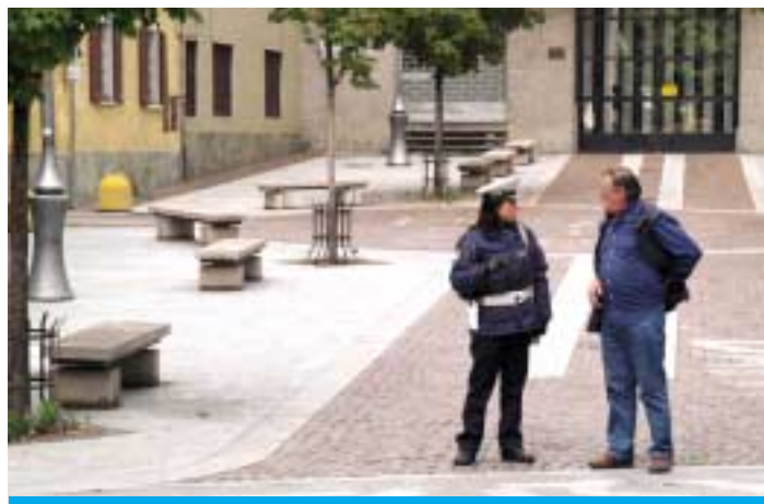
Il vigile di quartiere al lavoro in piazza Addolorata

tutti i giorni per un turno di sei ore (mai lo stesso visto che i turni, su base settimanale, sono mattutini o pomeridiani) percorre a piedi i tratti principali del quartiere, per un controllo tipico di vicinanza, di prossimità ai cittadini. Un controllo preventivo, realizzato da agenti appositamente addestrati in termini di comunicazione, repressione e raccolta delle segnalazioni.