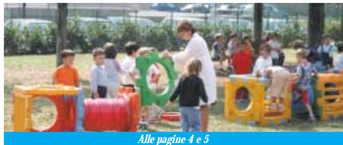
Alle pagine 4 e 5

guiranno le iniziative volte a favorire nei più piccoli un'educazione alla lettura realizzate dalla Biblioteca Civica.