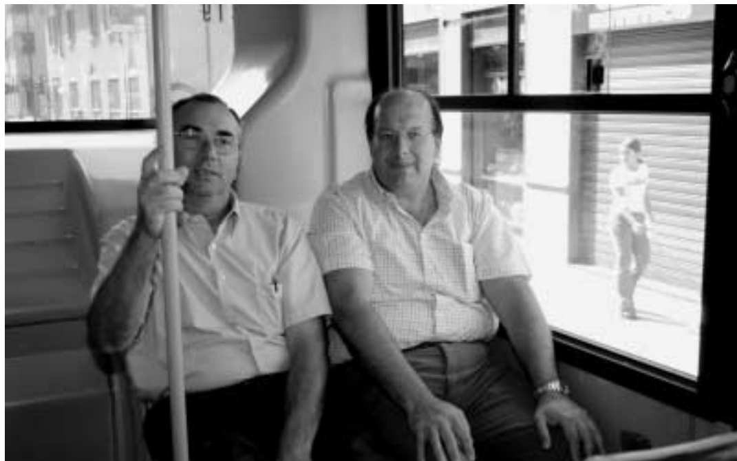
Il sindaco (a destra) e l'assessore ai trasporti sulla linea blu

Cassina Amata era l'anello debole del precedente tragitto della li-