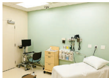
Ambulatori medici o dentistici