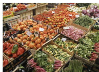
Magazzini conservazione frutta e verdura