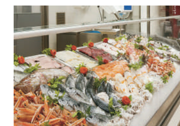
Magazzini conservazione pesce