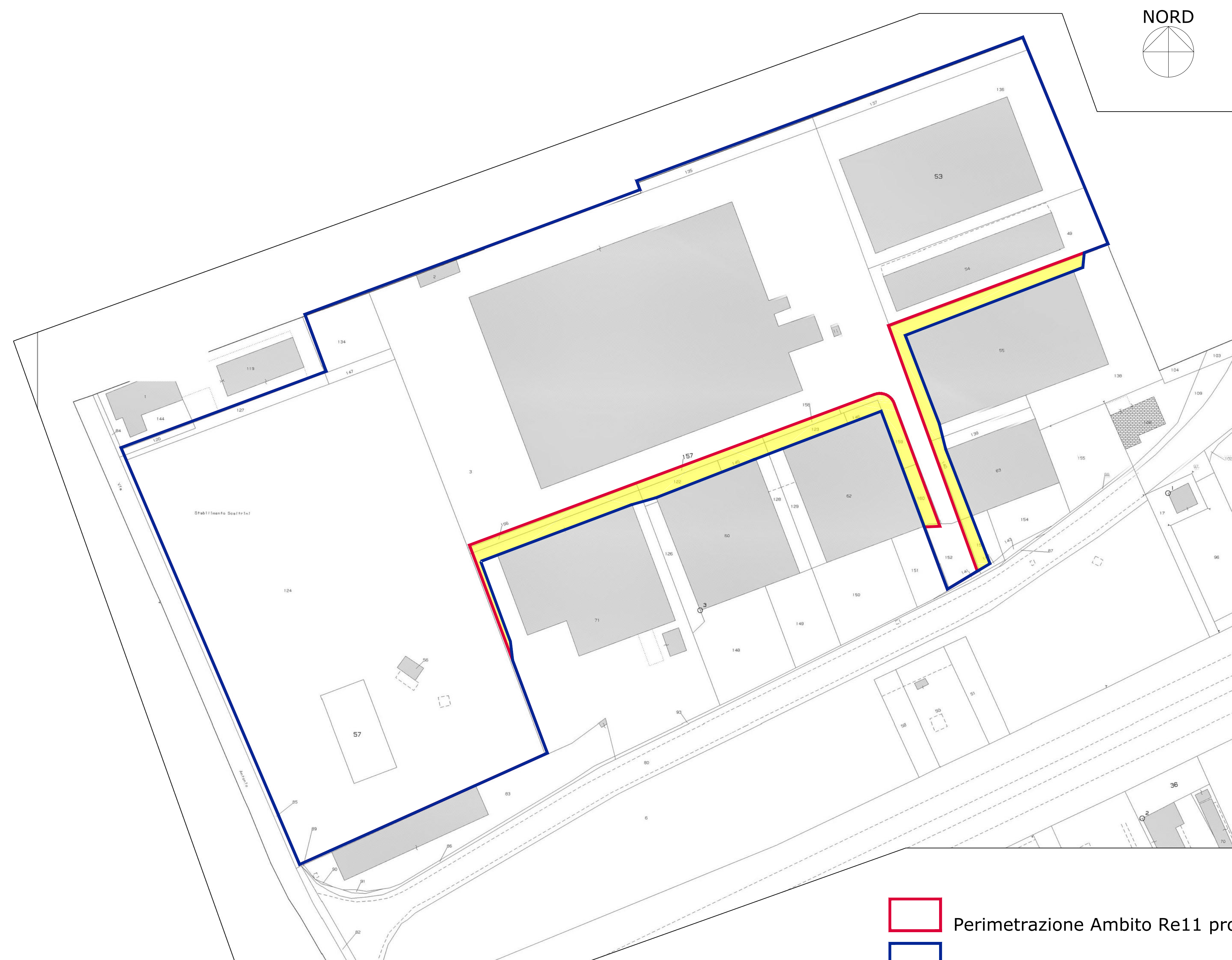
ESTRATTO CATASTALE dal Foglio 57 - 1/1000 con comparazione fra perimetrazione di PGT e proposta