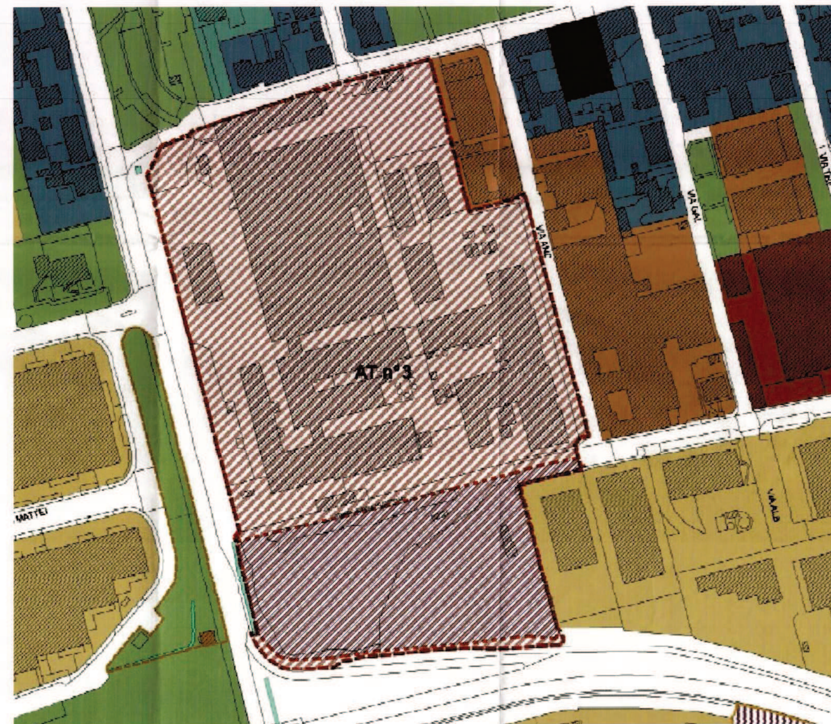
ESTRATTO P.G.T. VIGENTE 1:1000