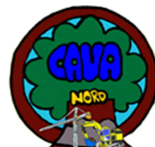
Logo vincitore 6° concorso Cava Nord 2016

Indetto da Cava Nord Srl - Paderno Dugnano in memoria di Luigi Tonelli e della moglie Rosetta, in collaborazione con il Comune di Paderno Dugnano .