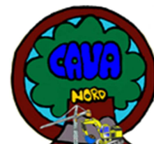
Logo vincitore 6° concorso Cava Nord 2016