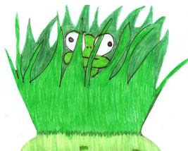
Mascotte vincitrice 2° concorso Cava Nord 2011