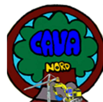
Logo vincitore 6° concorso Cava Nord 2016